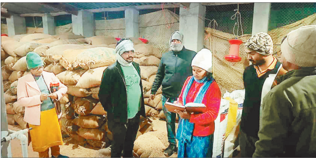
जांच करते प्रशासनिक अधिकारी।